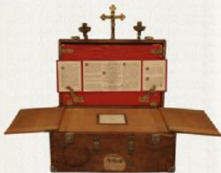
Altaarkist van rondtrekkende zendingen