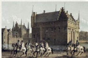
De Duitse Orde in het kasteel van Gemert