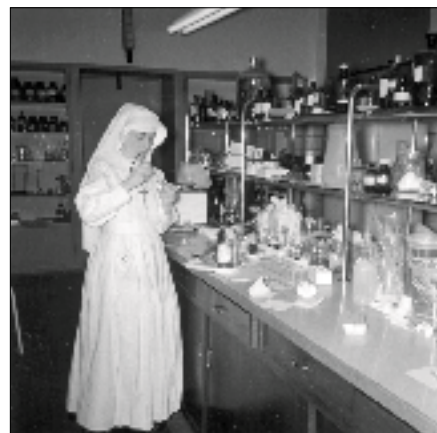
Zusters van Julie Postel, laboratorium in het ziekenhuis

in 1910 naar Nijmegen, waar ze onderwijs gingen geven. Het pand dat zij in Oss hadden bewoond, werd aanvankelijk gemeentehuis. Sinds 1974 is het Museum Jan Cuneneer gehuisvest.