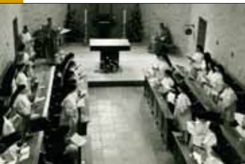
Kloosterkapel na de herinrichting van 1968

Halverwege de 19 e eeuw bouwde de gemeenschap in het nabije Ravenstein een nevenklooster: Huize Nazareth. De onderwijstaak die de zusters daar uitoefenden, werd rond 1920 overgenomen door zusters van de Sociëteit van JMJ.