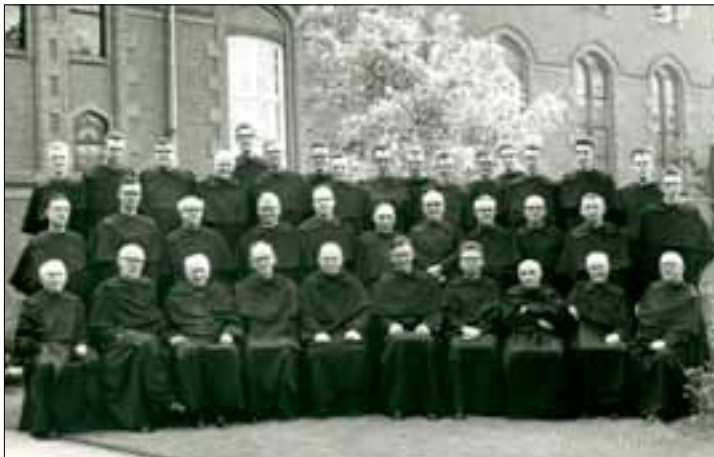
De gemeenschap van Boxmeer, ca. 1960.

veranderde de orde enigszins van karakter. In navolging van de Franciscanen en Dominicanen vestigden de Karmelieten zich in de steden en droegen bij aan het stadsapostolaat. Het eerste klooster op Nederlandse bodem werd in 1249 gesticht in Haarlem. Binnen de orde is steeds een spanningsverhouding blijven bestaan tussen de oorspronkelijke leefwijze en latere aanpassingen.