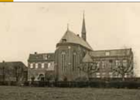
Na de verbouw van 1912, met links het rectoraatshuis

die reeds als kostjuffrouwen in het klooster woonden, werden zo spoedig mogelijk in de gemeenschap opgenomen en het klooster bloeide op.