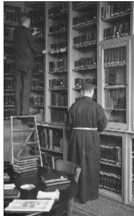
Bibliotheek in het broederhuis van Huize Padua

Van de twee kluizen van de broeders uit de beginperiode in Handel is niets bewaard gebleven. Het terrein in Boekel is in gebruik van de GGZ Oost-Brabant. In het oudste gebouw uit 1742 is thans het museum De Kluis gehuisvest. Hier wordt een beeld gegeven van de geschiedenis van de Broeders Penitenten, van Huize Padua en van de psychiatrie in Nederland. De kapel kon van sloop worden gered door er appartementen in te bouwen.