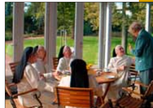
De voormalige bewoners in een nieuwe aanbouw, 2003

Toen tegen het eind van de 20 e eeuw de gemeenschap in Deursen vergrijsde, nam zij in 1997 haar intrek in het kloosterbejaardenoord Sint Jozefoord te Nuland. Het klooster Soeterbeeck werd geschonken aan de Radboud Universiteit van Nijmegen, die als tegenprestatie zorgde voor de restauratie en voor onderzoek naar de Moderne Devotie. Bij de restauratie bleven oude elementen zo veel mogelijk behouden: vloeren, deuren, tegels, stucwerk, meubilair en kunstvoorwerpen. Ook de tuin werd door de nieuwe eigenaar heringericht, met behoud van de Lourdesgrot die door de zusters was gebouwd. Het voormalige klooster functioneert sindsdien als studie- en ontmoetingscentrum. De kostbare bibliotheek van de zusters vormt voortaan een onderdeel van de universiteitsbibliotheek. Hun archief is ondergebracht bij het bisdom 's-Hertogenbosch en bij het Erfgoedcentrum Nederlands Kloosterleven in Sint Agatha.