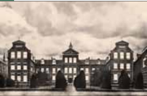
Het moederhuis van de Franciscanessen van Veghel