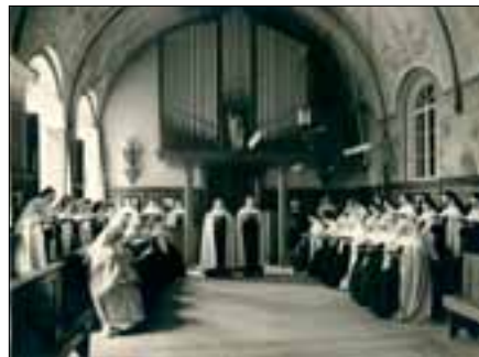
Koorgebed in Elsendael