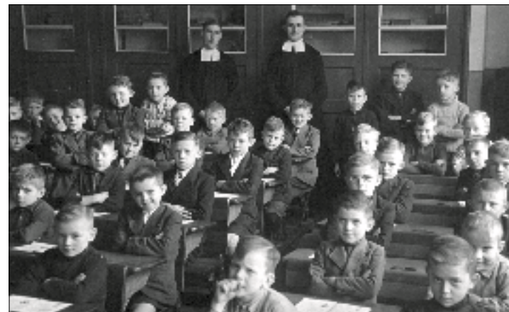
Broeders van de Christelijke Scholen geven onderwijs

Vanaf de jaren zestig van de vorige eeuw veranderde het katholieke landschap. Door vergrijzing van de leden heeft inmiddels het overgrote deel van