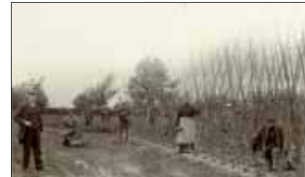
Werken op de akkers van Huize Padua, ca. 1925