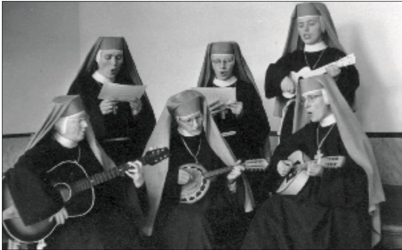
Zusters Penitenten, ca. 1967.

toestemming en er vertrokken vijf zusters van Haren naar Reek. Dit leidde op den duur tot een zelfstandig klooster in deze plaats. Met de stichting van Reek kwam er in het leven van de Zusters Penitenten een nieuw element binnen: naast boerderij en handenarbeid gingen zij zich wijden aan onderwijs om in hun levensonderhoud te voorzien, ook in Haren. Rond 1900 werd er een onderscheid ingevoerd tussen koorzusters en lekenzusters. De eersten dienden zich volledig te wijden aan het beschouwende leven. De tweede groep zusters had ook de opvoeding van de jeugd tot taak. Rond het midden van de 20 e eeuw kwam aan deze tweedeling weer een einde. De overheid vereiste voortaan van iedereen die in het onderwijs werkzaam was een vakdiploma en ook het bijwonen van vergaderingen. Dit deed te veel afbreuk aan het primaire levensdoel van de zusters: een leven leiden van gebed en eenvoud in de geest van het evangelie. Zij stopten daarom met hun onderwijstaken.