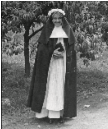
Bij gelegenheid van een professiefeest in 1945

Windesheim bij Zwolle. Het aantal kloosterlingen groeide snel, zowel mannen als vrouwen. Zij leefden volgens de regel van Augustinus. Hun taken bestonden uit het bidden