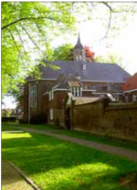
Birgittinessenklooster