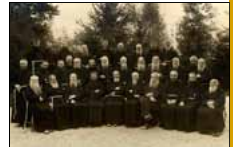
De gemeenschap van Velp, ca. 1930