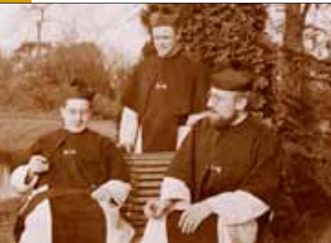
Kruissheren in de kloostertuin, ca. 1930