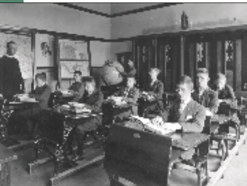
Blindenzorg in Grave.

voor blinde jongens. De Zusters van Liefde van Tilburg volgden hun voorbeeld en gaven er vanaf 1882 onderwijs aan blinde meisjes en vrouwen. Zo werd Grave het centrum van de katholieke blindenzorg. Hier werd in 1868 de handdrukpers voor brailleschrift uitgevonden, het begin van een brailledrukkerij en een R.K. Leesbibliotheek van braillewerken. Vanaf 1955 zorgden de fraters ook voor ingesproken boeken. De blindenzorg in Grave is rond 1980 overgenomen door leken en is nu bekend onder de naam 'Visio'.