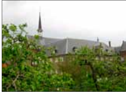
Franciscanen klooster in Megen

Na een eerste mislukte poging om vanuit Italië in Duitse steden vestigingen te beginnen, trokken in 1221 opnieuw Franciscaanse broeders de Alpen over tot Keulen, nu beter voorbereid. Zeven jaar later trokken er