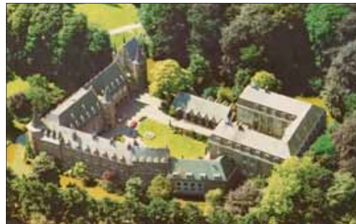
Luchtfoto, waarop ook de noodkapel uit 1936 en de eetzaal van 1962 zichtbaar zijn

Tegen het einde van de 20 e eeuw voorzagen de Spiritijnen, dat zij vanwege de vergrijzing van hun gemeenschap het kasteel zouden gaan verlaten. Zij startten gesprekken over de herbestemming van het complex. In afwachting van de uitkomst verhuisden de paters in 2010 naar Gennep. De onderhandelingen over een nieuwe bestemming duurden in 2011 voort.