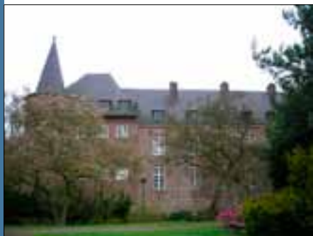
Kasteelklooster in Gemert

Verder was er de commanderij van Gemert: een zelfstandig staatje dat toebehoorde aan de Duitse Orde, een uit de tijd van de kruistochten daterende ridderorde. De orde zetelde in een kasteel, gebouwd in het begin van de 15 e eeuw. Priesters van de orde zorgden voor de zielzorg in de nabije omgeving. Na de Vrede