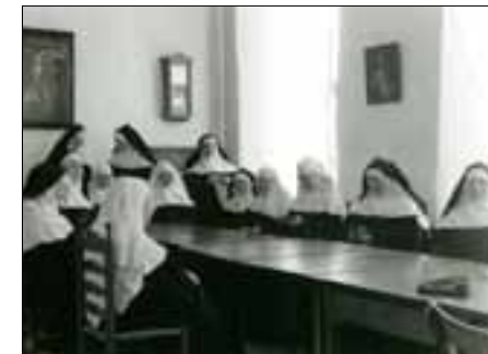
Dagelijkse recreatie

de komst van Karmelietessen. De zusters vonden in Boxmeer een woning en een kapel die reeds voor gebruik waren ingericht. In het testament van pastoor Peelen was ook opgenomen, dat de zusters die Elsendael zouden betrekken onderwijs dienden te geven aan de arme kinderen van Boxmeer. Dit was strijdig met de leefwijze van de Karmelietessen, maar er werd een oplossing gevonden: de onderwijzeres moest in de deuropening van het klaslokaal blijven staan, zodat ze toch aan de slotregels voldeed! Pas in 1865 droegen de zusters hun onderwijstaak over aan een andere klooster-gemeenschap, die toen in Boxmeer kwam wonen: zusters van de Sociëteit van JMJ.