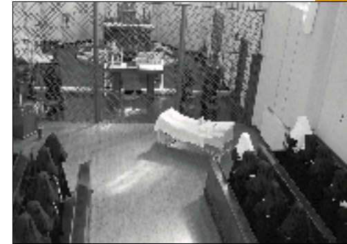
Kapel van het klooster, ca. 1960

De geschiedenis van de klooster-gemeenschap in Megen gaat terug tot 1472, toen in Boxtel het klooster Sint Elisabeth werd gesticht. Tijdens de Tachtigjarige Oorlog werd het klooster verwoest en van 1578 tot 1611 zochten de zusters hun toevlucht in 's-Hertogenbosch. In 1717 moesten ze Boxtel definitief verlaten. Na een tijdelijke verblijf in België verwierven de zusters grond in Megen: het perceel waar het kasteel van de heren van Megen had gestaan, dat in 1581 verwoest was. In 1720 arriveerden de eerste zusters. Na een tijdelijk verblijf in een huurhuis konden zij in 1721 hun nieuwe klooster betrekken. Dit kreeg de naam Sint Jozefsberg. Het gebouw bestond uit vier vleugels rondom een binnentuin. Bij de bouw werd gebruik gemaakt van de fundamenten van het vroegere kasteel.