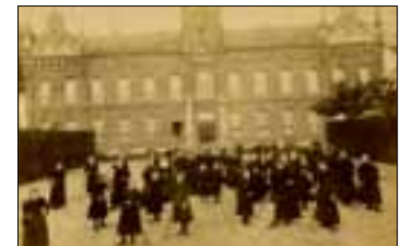
Het pensionaat van de Zusters Ursulinen in Uden