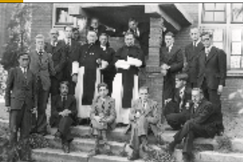
Klasfoto, ca. 1935