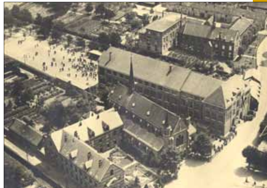
Het kloostercomplex in Uden, ca. 1950

In 2009 is het klooster gesloten en verkocht aan de zorginstelling Brabant Zorg. In samenwerking met Brabant Zorg werden voor de Kruissheren zorgappartementen gebouwd in de voormalige tuin van het klooster. Ook het eigendom van de kapel is overgegaan naar de zorginstelling. Een beheerstichting waarin zowel de Kruissheren als de nieuwe eigenaar vertegenwoordigd zijn, regelt de activiteiten in dit gebouw. De kapel is dagelijks toegankelijk. Het College van het H. Kruis maakt momenteel deel uit van het Udens College.