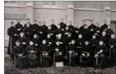
Broeders Penitenten, 1897

De broeders vormden nog steeds een wereldlijke vereniging, vanaf 1855 opererend onder de naam Vereniging van Landbouw en