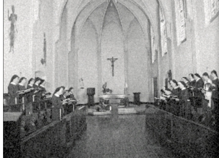
De huidige kloosterkapel.