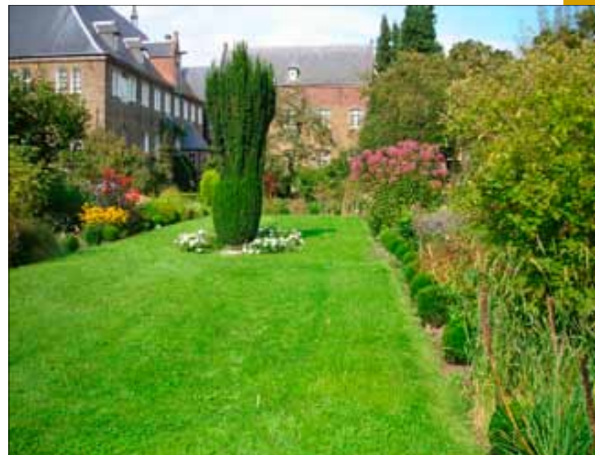
Hof van Lof

Everardus op zijn sterfbed. Er kwam een stroom van gebedsverhoringen op gang: in 1954 waren er reeds 1.463 per brief of briefkaart in Megen gemeld. In 1958 werd een proces van zaligverklaring in gang gezet. Dat is inmiddels stopgezet, maar de bezoekers zijn blijven komen om hun intenties aan 'het heilig bruurke' toe te vertrouwen. Vaak stoppen zij een briefje met een verzoek in de mouw van het beeld op zijn graf.