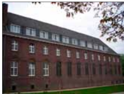
Noviciaatsvleugel van het paterklooster

De zusters maakten in de loop van de tijd een en ander mee. Reeds in 1682 werd de eerste steen gelegd voor een nieuwe kapel. De zusters braken bouwvallige gedeeltes van het huis af en voegden nieuwe bijgebouwen toe. In 1740 hadden ze zwaar te lijden onder een overstroming van de