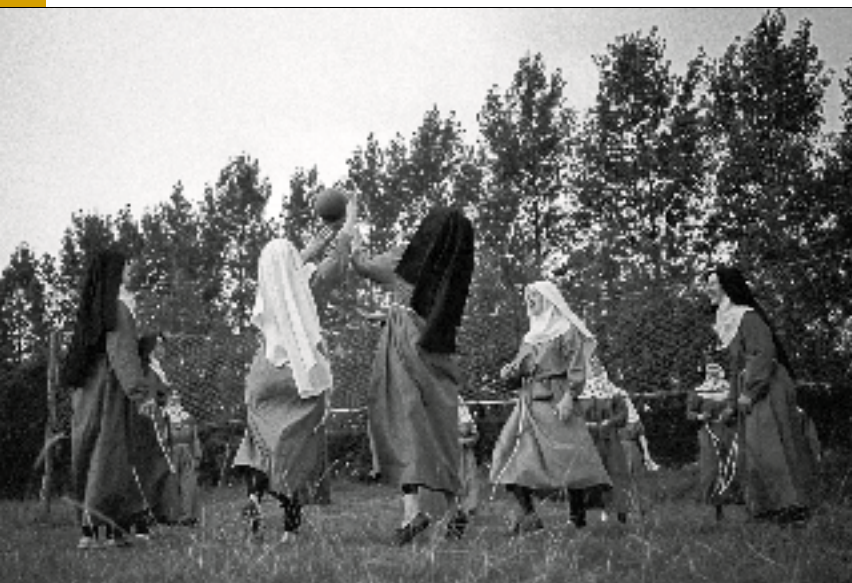
Recreatie, ca. 1960.

Rond 1800 brak ook voor de Clarissen een tijd van onrust en onzekerheid aan, met de dreiging van invallen en plunderingen door soldaten. Tussen 1812 en 1814 moesten zij hun klooster verlaten en na terugkomst mochten ze geen nieuwe leden aannemen: koning Willem I bepaalde dat de opheffingsbesluiten van Napoleon van kracht bleven. Hopend op betere tijden namen zij in het geheim echter toch novicen aan. Deze konden in 1840 hun kloostergeloftes afleggen, toen koning Willem II een einde maakte aan het verbod op nieuwe kloosterlingen. Vanuit Megen stichtten de Clarissen in 1876 een klooster in Ammerzoden, met het oog op een vluchtplaats voor het geval er opnieuw moeilijke tijden zouden aanbreken.