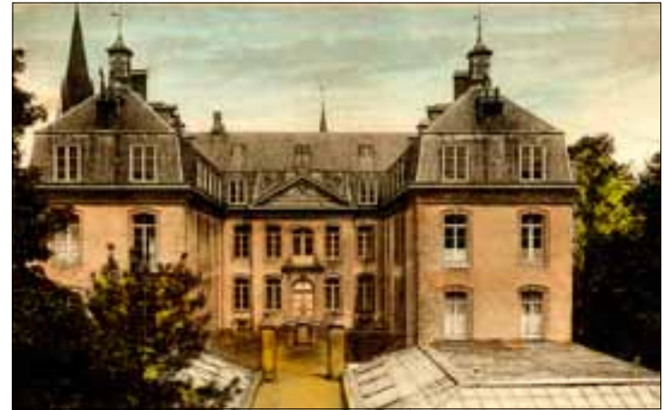
Het hoofdgebouw na 1883

Claude-François Poullart des Places. In 1848 fuseerde ze met de Congregatie van het Heilig Hart van Maria, gesticht door François Libermann. Het doel van de gemeenschap was het brengen van de Blijde Boodschap van het evangelie naar de armste mensen ter wereld. De Spiritijnen vormen een echte missiecongregatie, met leden overal ter wereld.