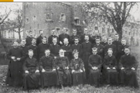
De gemeenschap van Spiritijnen in 1929

volledige soevereiniteit en konden de katholieken hier weer vrij hun geloof belijden.