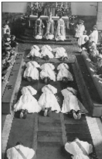
Priesterwijding in Gemert, 1956