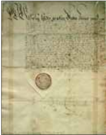
Een vrijgeleidebrief van Willem van Oranje, 1575