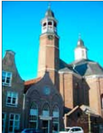
De huidige Luciakerk met op de voorgrond de voormalige kapel van de Mariacongregatie

ten) bewonen en vervulden van daaruit in de omgeving hun pastorale taken. Rond 1650 waren er op die manier bijna 100 Jezuïeten in de Hollandse Zending werkzaam, bijna evenveel als de leden van alle andere kloosterorden tezamen.