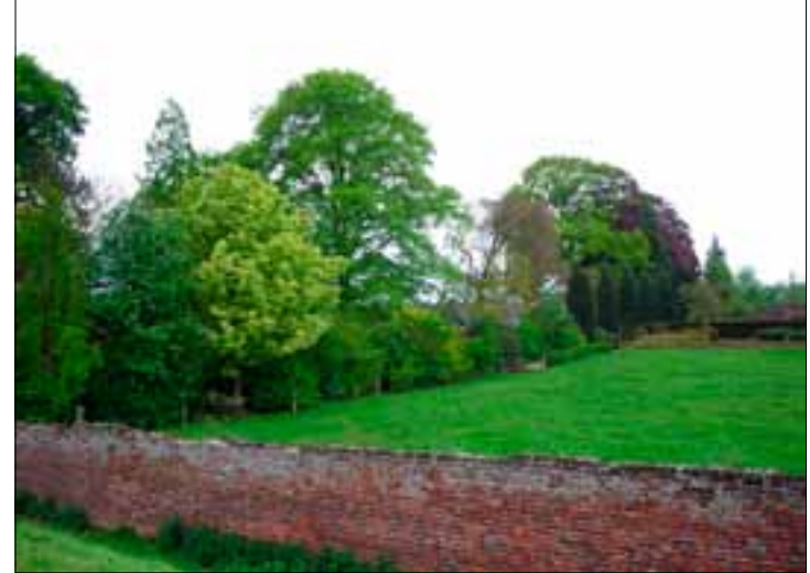
De huidige kloostertuin

De Kruissheren bewaren in Sint Agatha bijzondere erfgoedcollecties: een oud archief, eeuwenoude boeken en (kunst)voorwerpen. Ca. 100 andere orden en congregaties uit heel Nederland besloten om hier eveneens hun erfgoed onder te brengen, dat voor belangstellenden toegankelijk wordt gemaakt. Kloostergemeenschappen hebben in de loop der eeuwen voor de Nederlandse samenleving veel betekend. Welke idealen hadden zij, hoe zag hun dagelijks leven er uit en waar zijn de sporen van hun werk te vinden? Deze vragen staan in het erfgoedcentrum centraal. Met het oog op het centrum is in 2004/2005 de voorvleugel van het kloostercomplex gerenoveerd. Daarnaast is een depot gebouwd, dat ongeveer 6,5 km archief- en bibliotheekmateriaal kan herbergen. In 2009 is het poortgebouw van het klooster gerestaureerd en ingericht als bezoekerscentrum.