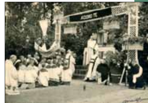
Processie bij de Dominicanen in Langenboom

Een andere orde die uit de middeleeuwen stamt, de Orde der Predikheren oftewel de Dominicanen, waren tot 1837 weinig actief in Noordoost-Brabant. Maar toen verplaatsten zij, nog voordat koning Willem II het beleid jegens kloosterlingen versoepelde, hun noviciaat vanuit België naar Uden. De provinciaal, pater Raken, kwam met de autoriteiten overeen dat de Dominicanen “gerustelijk (zonder echter triomf te blazen) het habijt openlijk konden dragen”. Het verblijf in Uden was van korte duur: in 1842 verhuisden de novicen naar Nijmegen. Tien jaar later kwamen ze echter terug naar Noordoost-Brabant, naar het rustig gelegen plaatsje Langenboom. Het