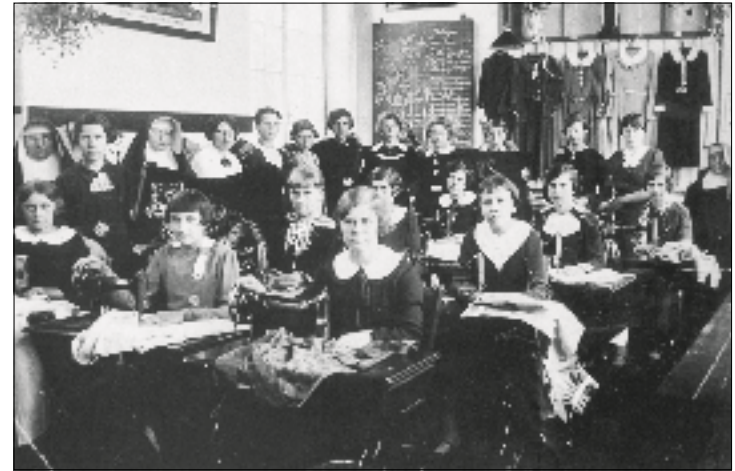
Modevakschool van de Zusters Penitenten, ca. 1920

Aanvankelijk ging de onrust van de reformatie aan het klooster voorbij, maar rond 1580 kreeg het toch te maken met de gevechten van de Tachtigjarige Oorlog. Soldaten namen het klooster in en de zusters vluchtten naar Grave. Dankzij de steun van de graven van Megen konden zij in 1642 terugkeren naar hun vestiging in Haren, die helemaal moest worden hersteld. Daarna braken er betere tijden aan. In 1671 werd het huis vergroot en in 1707 bouwden de zusters een nieuwe refter en kerk. In 1732 kreeg het klooster nieuwe statuten, waarin de activiteiten van de zusters werden geregeld evenals de functies in het klooster. De nadruk lag op het stilzwingen, op dagelijkse meditatie, geestelijke lezing en gewetensonderzoek, op arbeid en boetedoening. Hoewel de statuten beperkingen bevatten ten