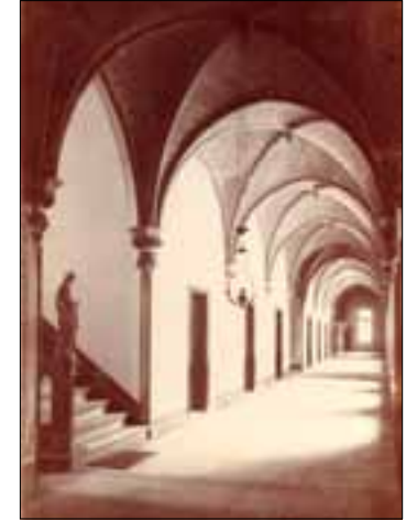
Kloostergang in Velp

de komst van novicen was er meer ruimte nodig. Er werd een huis aangekocht naast de Ravensteinese pastorie, dat werd verbouwd en voorzien van een kapel (Sint Luciastraat 5). De neoromaanse éénbeukige kapel werd aan Sint Jozef toegewijd. Het aantal novicen nam snel toe, waardoor moest worden uitgezien naar grotere huisvesting. In Velp, bij Grave, werd een perceel land aangeboden. In 1862 begonnen de Jezuïeten er met de bouw van het noviciaat Mariëndaal. Toen de Jezuïeten in 1865 Ravenstein verlieten, hadden zij hier en in Velp reeds 200 novicen opgeleid. De parochie werd overgedragen aan het bisdom Den Bosch. Het opleidingshuis in Velp bleef in functie tot 1966 (Tolschestraat 2, www.mariendaalvelp.nl ).