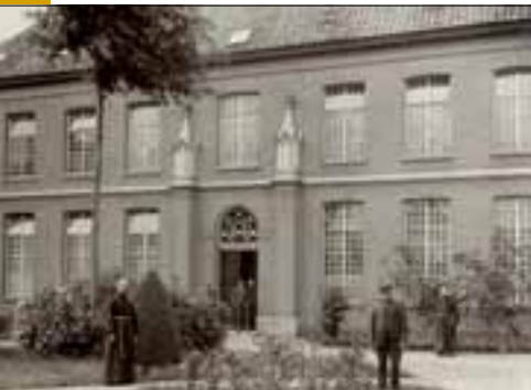
Huize Padua, paviljoen Sint Jozef, ca. 1930

hijmelijke vijanden van onze godsdienst gevonden worden”. In de loop van de 19 e eeuw nam zowel aantal broeders als het aantal patiënten gestaag toe. Uitbreiding was nodig. Tot 1839 had een van de kamers van Huize Padua als gebedsruimte gediend, maar nu kregen de broeders een eigen kapel. Vanaf 1846 was er op het terrein ook een ‘herenhuis’, waar priesters die buiten functie waren geraakt tot rust konden komen. Paters Redemptoristen gaven hen geestelijke begeleiding in de vorm van retraits. In 1856 kwam het Sint Jozefpaviljoen gereed, in 1887 de paviljoens Franciscus, Dymphna en Maria, in 1892 een verbouwing van het paviljoen eerste klas. Vanaf 1872 waren de patiënten gescheiden in een eerste, tweede en derde klasse, elk in eigen huisvesting. Er moesten