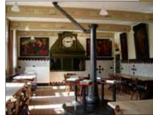
De refter van het Kapucijnenklooster

In de kerk liggen tenminste 97 Kapucijnen begraven. Slechts van enkelen is een grafsteentje te vinden. Meer aandacht krijgt de nagedachtenis van een aantal weldoeners, die bij de bouw van kerk en klooster hun aandeel leverden. Op