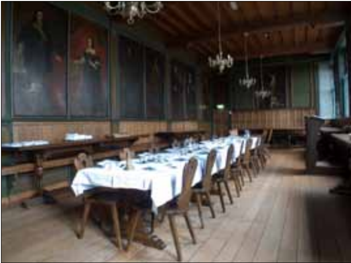
Refter met portretschilderijen.

beschikt eveneens over een serie portretschilderijen van adellijke personen, die hebben bijgedragen aan de bestaansmogelijkheden.