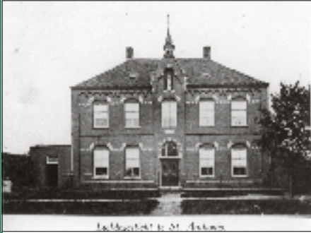
Het huis van de Zusters van Schijndel in Sint Anthonis