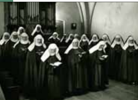
Zusters Redemptoristinnen in Sambeek

werk. In de kloosters die al voor 1800 in deze streek waren gesticht, woonden zusters van contemplatieve gemeenschappen: Clarissen, Zusters Penitenten, Reguliere Karmunnikessen, Karmelietessen en Birgittinessen. Twee beschouwende orden kwamen er nadien nog bij.