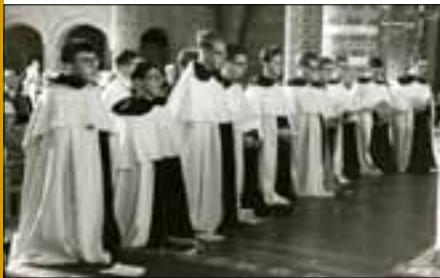
Inkleding van Karmelieten in de kloosterkerk, 1964.

Gezien vanuit de straatkant, ligt rechts naast het klooster de voormalige Latijnse school, geopend in het begin van de 18 e eeuw. Achter het oorspronkelijke kloostercomplex is rond 1930 een nieuwe vleugel aangebouwd, in verband met het grote aantal novicen (zichtbaar vanaf het Kerkpad). Links naast het klooster ligt de kerk, toegewijd aan Sint Petrus. De huidige kerk is gebouwd door architect Wilhelm Valk uit Vught, nadat de vorige in 1944 werd verwoest. In de crypte zijn nog de fundamenten