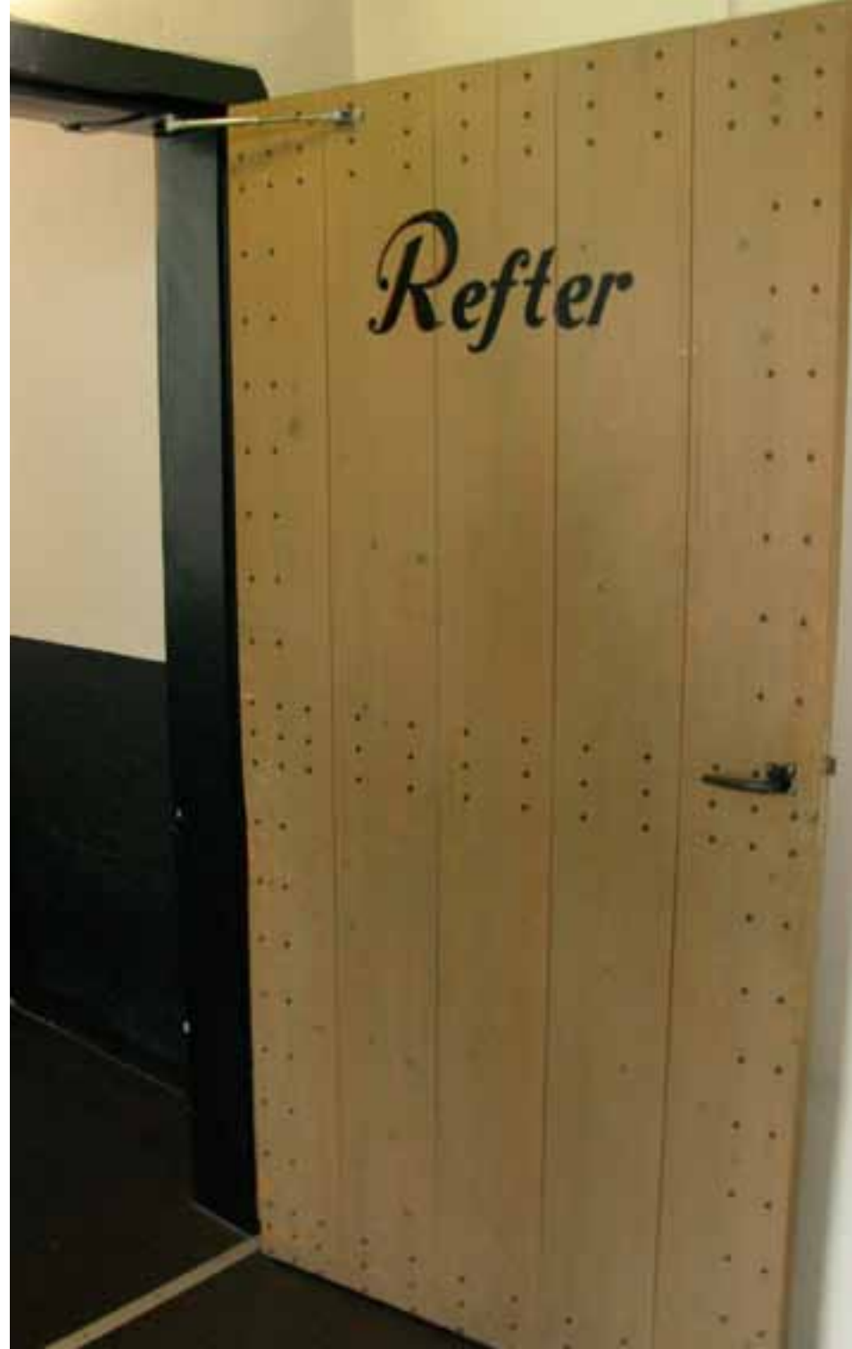
De deur naar de eetzaal (refter), 2010