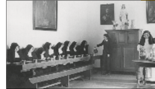
De refter van het klooster, 1948

De kloostergemeenschap Soeterbeek ontstond in 1448 in het Brabantse Nederwetten (bij Eindhoven) als een klein convent van Zusters van het Gemene Leven. De naam van de gemeenschap werd ontleend aan een nabijgelegen beekje: de Suetbeek. De zusters verhuisden in 1462 naar het nabij gelegen Nuenen. In 1732 werden ze door de overheid uit hun klooster verdreven en trokken ze naar Deursen, in het vrije Land van Ravenstein.