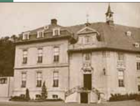
Het kasteelklooster van de Zusters van Julie Postel