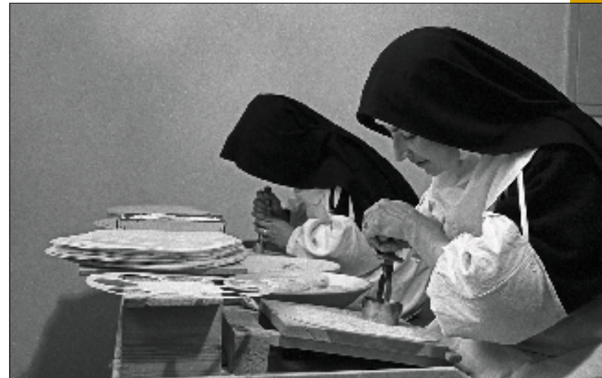
Hostiebakkerij, ca. 1960.