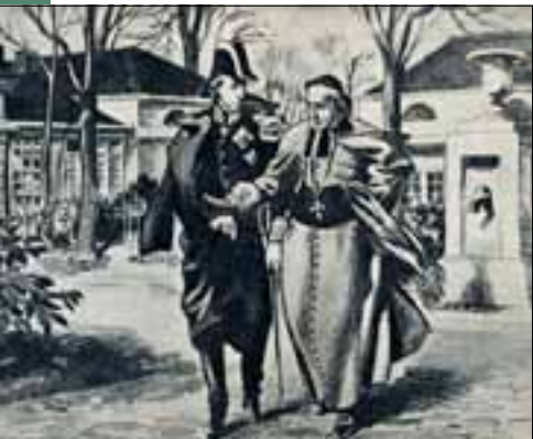
Koning Willem II was bevriend met de latere bisschop Zwijnen

Toen Napoleon in 1814 was verslagen, besloten de overwinnaars op het Congres van Wenen dat de Noordelijke en de Zuidelijke Nederlanden voortaan samen zouden gaan als één koninkrijk. Koning Willem I, zoon van de laatste stadhouder Willem V, kreeg de leiding. De enclaves in Noord-oost-Brabant werden uiteindelijk opgenomen in de nog steeds bestaande Provincie Noord-Brabant.