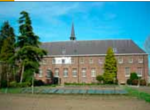
Kapucijnenklooster vanuit de tuin

onder water te staan. In 1715/1716 veroorzaakte de wateroverlast zoveel schade, dat het huis Emmaüs niet meer bewoonbaar was. Men besloot tot de bouw van een nieuw kloostercomplex, dat er tot op vandaag nog staat. Het gebouw is in verschillende fasen opgetrokken. Na de definitieve oplevering in 1733 is er nauwelijks meer iets aan veranderd. Je waant je in dit klooster meteen in de 18 e eeuw.