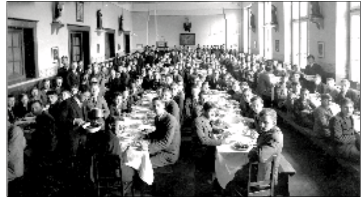
De eetzaal van het college, 1929

van deze plek. Maria werd er vereerd om vruchtbaarheid te geven aan mens, vee en akkers. De Kruisheren zetten zich in voor deze Mariaverering. Het financiële voordeel van de zorg voor een dergelijke devotieplek kwam hen daarbij niet ongelegen: hun bezittingen in Staats-Brabant werden in 1658 geconfisqueerd.