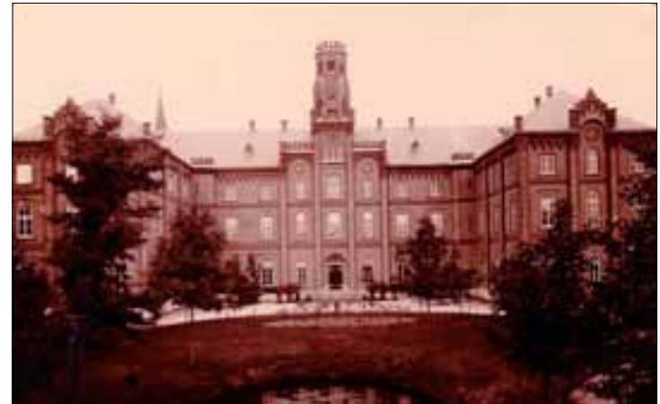
De voorgevel van het noviciaat in Velp.

In 1630, een jaar na de inname van Den Bosch, kwam het Land van Ravenstein in handen van hertog Wolfgang Wilhelm van Neuburg. De hertog had zich in 1613 bekeerd tot het katholieke geloof. Zijn land stond open voor kloosterlingen en priesters. Dat kwam voor hen goed uit toen zij uit de aangrenzende Meierij van Den Bosch moesten vertrekken. De eerste Jezuïeten die naar Ravenstein kwamen, vielen onder jurisdictie van Michael Ophovius, de bisschop van Den Bosch die zelf al zijn residentie had moeten verlaten. Zij bleven slechts korte tijd. De hertog wenste dat Ravenstein onder het gezag viel van de aartsbisschop van Keulen. Hij gaf in 1633 aan de Jezuïeten van de Keulse (Nederrijnse) provincie het recht tot missiearbeid in het Land van Ravenstein, met uitsluiting van alle andere orden, met name van de Kapucijnen.