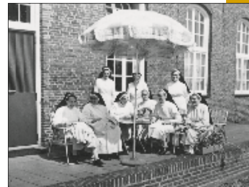
Bijeenkomst van de internationale Congregatie, 1970

De kloostergebouwen ondergingen in de loop van de tijd een aantal ingrepen. In het begin van de 20 e eeuw werd de vleugel uit 1744 vervangen en werd er een nieuw rectoraatshuis gebouwd. In 1968 veranderden de zusters de neogotische inrichting van hun kapel volgens de liturgische inzichten uit die jaren. De ruimte kreeg tevens een verlaagd plafond om hem beter te kunnen verwarmen.