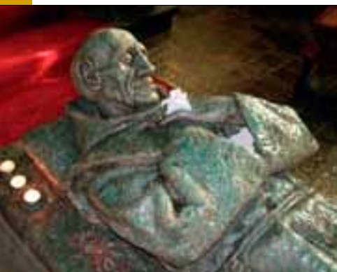
Graftombe van 'het heilig bruurke', met intentiebriefjes

Witte. Deze was jarenlang portier van het Megense klooster geweest. Hij bood de vele bezoekers een luisterend oor, waaraan zorgen en pijn werden toevertrouwd. Al tijdens zijn leven kreeg hij de bijnaam 'het heilig bruurke'. Men vroeg hem om gebed. Na zijn dood nam de toeloop verder toe. In 1954 werd een grafkapel voor hem gebouwd, aan de zuidoostkant van het klooster. Op het graf staat een tombe, afgedekt met een beeld van broeder