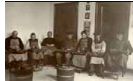
Patiënten in Huize Padua, ca. 1920