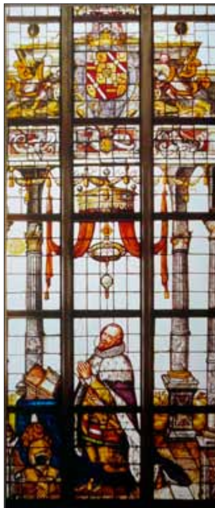
Prins Maurits schonk aan de Kruissheren van Sint Agatha een glas-in-loodraam, waarop hij zelf staat afgebeeld

Twee enclaves completeerden de rijke verscheidenheid van afzonderlijke miniaturstaatjes in Noord-oost-Brabant: de baronie Bokhoven en het ambt Oeffelt. Bokhoven, gelegen aan de Maas ten noorden van Den Bosch, was vanaf de 14 e eeuw een zelfstandige heerlijkheid, vanaf 1640 een graafschap. De katholieken uit Den Bosch konden in Bokhoven ter kerke gaan. In tegenstelling tot de bovengenoemde enclaves heeft deze streek slechts een beperkte kloostergeschiedenis. Na de inname van Den Bosch woonden er gedurende enkele jaren Norbertijnen en Wilhelmiëten.