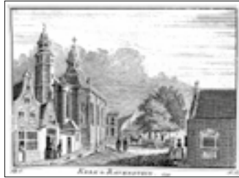
De Luciakerk van Ravenstein in 1741, in: Het verheerlykt Nederland , dl. 2 (Amsterdam 1746)

Toen de orde in 1540 pauselijke goedkeuring had verkregen, kwamen er al snel Jezuïeten naar de Noordelijke Nederlanden, zowel vanuit Duitsland als vanuit België. De pogingen om hier in één van de steden een college te vestigen, hadden vooralsnog geen succes: de reformatie had langzaam maar zeker terrein gewonnen. Het politieke klimaat was ongunstig voor katholieken en zeker voor de Jezuïeten, die inmiddels bekend stonden als trouwe aanhangers van de paus. Noord-Nederland verkreeg onder de naam Hollandse Zending de status van missiegebied. Jezuïeten gingen staties (missiepos-