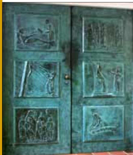
Deuren met afbeeldingen van de H. Birgitta

In 1973 werd in een deel van het klooster, waaronder de voormalige boerderij, een Museum voor Religieuze Kunst opgericht. Aanvankelijk bestond de collectie uit de voorwerpen van het bisschoppelijk museum