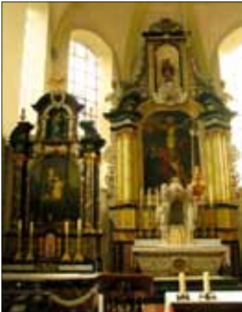
De kloosterkerk van de Franciscanen