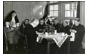
Bejaardenzorg door de Zusters van Schijndel