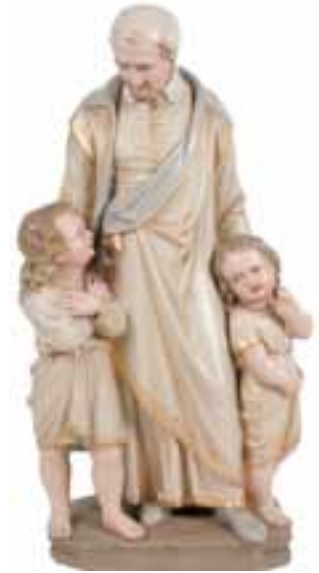
De H. Vincentius a Paulo