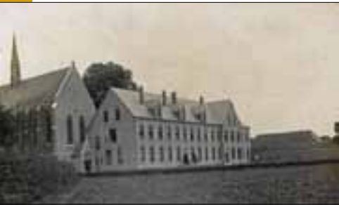
Het Kruissherenklooster in 1920

Net als bij andere kloostergemeenschappen nam na 1965 ook bij de Kruissheren het aantal intredingen sterk af. De gemeenschap van Sint Agatha vergrijsde. Het klooster was altijd zelfvoorzienend geweest: met een boerderij, wasserij, bakkerij, kleermakerij enz. Het aantal bewoners werd echter te klein om dergelijke voorzieningen in stand te kunnen houden. De boerderij werd in erfpacht gegeven. Voor de leegstand van gebouwdelen werden verschillende tijdelijke oplossingen gevonden, waaronder de verhuur van een kloostervleugel aan de Zusters van JMJ. Uiteindelijk werd in 2006 in dit klooster met zijn bijzondere geschiedenis het Erfgoedcentrum voor Nederlands Kloosterleven gevestigd.