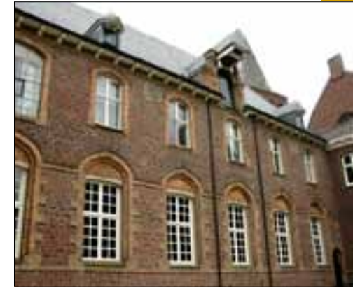
De binnenzijde van het klooster

De Karmelieten begonnen meteen na aankomst met de bouw van een klooster, dat bestaat uit vier vleugels met een binnentuin. Verrassend is, dat de meest versierde gevel van het klooster niet aan de straatkant ligt, maar naar binnen is gekeerd. Misschien dat de bouwers hiermee de voornaamste trek van hun spiritualiteit tot uitdrukking hebben willen brengen: een leven met God, in stilte en ingekeerdheid. Om de binnentuin ligen kloostergangen met prachtige glas-in-loodramen, waarop belangrijke personen uit de traditie van de Karmelieten zijn afgebeeld. Het klooster