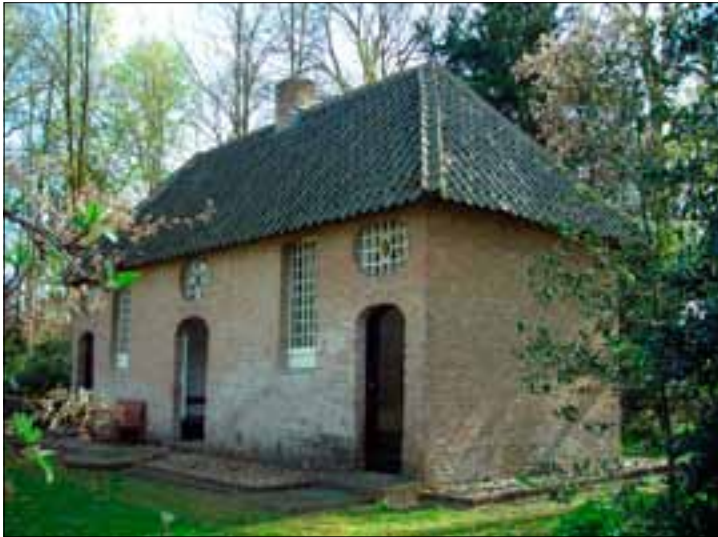
Pesthuisje van de Kapucijnen