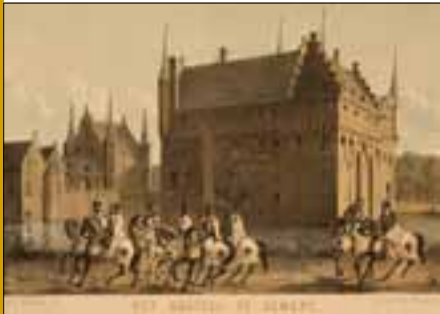
De Duitse Orde in het kasteel van Gemert Afbeelding: J. van Lennep en W.J. Hofdijk, Merkwaardige Kasteelen in Nederland , dl. 2 (Leiden 1854)

Zeventig jaar later betrok een nieuwe gemeenschap het kasteel. Uit Frankrijk gevluchte Jezuïeten verbleven er tot 1920. Daarna werd het kasteel bewoond door de Congregatie van de Heilige Geest, oftewel de Spiritijnen. Deze kloostergemeenschap werd in 1703 opgericht in Frankrijk door