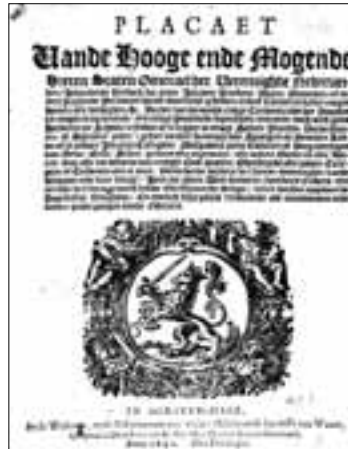
Plakkaat van de Staten-Generaal, met verordeningen tegen de uitoefening van het katholieke geloof

Herhaaldelijk vaardigde de overheid daarna nieuwe plakkaaten uit, waarin zij het uitoefenen van de katholieke eredienst verbood. De toon van de plakkaaten werd steeds strenger. Een plakkaat van 2 december 1636 kondigde aan dat “alle manspersoonen, als Abten, Praelaten, Paters, Papen, Canonicken, Monicken, ende alle andere diergelijcke” binnen twee weken moesten vertrekken uit de gebieden die onder de Staten-Generaal vielen. Zware straffen werden in het vooruitzicht gesteld voor hen die het gebod ontdoken. En als zij de opgelegde straf niet konden betalen, zou die ten laste komen van het dorp of de stad die hen geduld had.