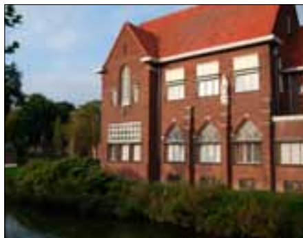
Het voormalige kloosters van de Zusters van JMJ in Boxmeer, momenteel cultureel centrum

jaar verzorgden zij in deze plaatsen onderwijs en ziekenzorg. In Grave ging het om onderwijs aan blinde meisjes. De zusters Ursulinen van de Romeinse Unie vestigden zich in 1845 in Uden met het meisjesspensionaat Nazareth. Vanuit Den Bosch kwamen er in 1865 zusters van de Sociëteit van Jezus, Maria en Jozef (oftewel Zusters van JMJ) naar Boxmeer. Later vestigden zij zich ook in onder andere Ravenstein en Heeswijk. Van 1967 tot 1984 woonde er een gemeenschap van oudere zusters in het Kruissherenklooster van Sint Agatha, in de vleugel waar nu het Erfgoedcentrum Nederlands Kloosterleven is gevestigd.