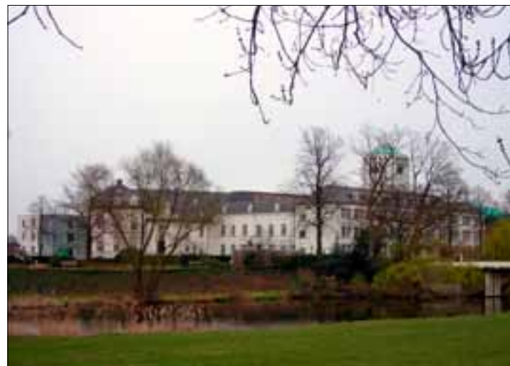
Kloosterbejaardenoord Sint Anna in Boxmeer

de kloostergemeenschappen de deuren moeten sluiten, ook in Noordoost-Brabant. Religieuzen verdwenen uit het straatbeeld en uit het dagelijks leven. Gebouwen, straatnamen, scholen of zorginstellingen herinneren echter overal in de regio aan hun aanwezigheid en aan hun activiteiten. En in een aantal plaatsen kan nog steeds op een kloosterpoort worden geklopt.