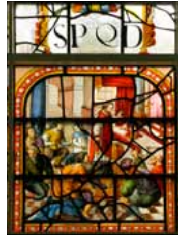
Glas-in-loodraam met voorstelling van het H. Bloedwonder

bouw heeft de uitstraling van een parochiekerk, hoewel voorin nog koorbanken staan voor het koorgebied van kloosterlingen.