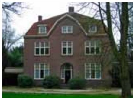
Pastorie van de Priesters van het H. Hart in De Rips