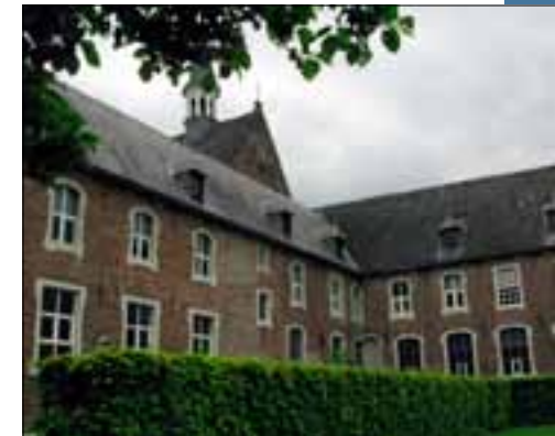
Klooster Elsendael, Boxmeer