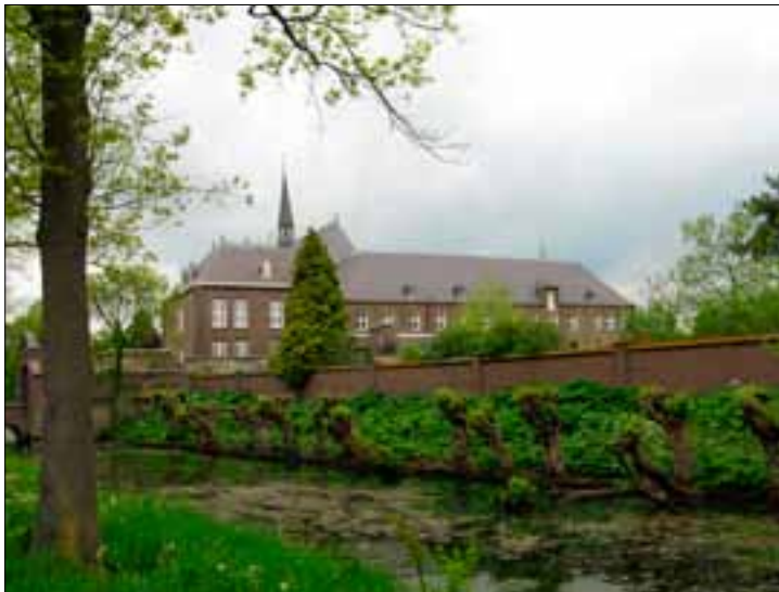
Clarissenklooster in Megen

De Heilige Clara (1193-1253) was een tijdgenote van Sint Franciscus. Ze bewonderde de leefwijze van Franciscus en wilde in zijn voetsporen treden. Beiden zochten naar een radicale beleving van het evangelie: naar een vorm van kloosterleven waarin de navolging van Christus in armoede, eenvoud en dienstbaarheid centraal stonden. Clara groeide op in een welvarende familie, maar besloot in 1212 om heimelijk van huis te vluchten en het leven van kloosterling te gaan leiden. Andere vrouwen sloten zich bij haar aan, waaronder haar zusje Agnes. Ze vestigden zich bij het kerkje van San Damiano (Italië), waar Clara de rest van haar leven zou doorbrengen. Zij stond erop dat de zusters geen vaste inkomsten hadden. Ze leefden van handwerk en van wat hen door de bevolking werd toebedeeld. De zusters werden bekend als de Arme Vrouwen van San Damiano. Nog tijdens het leven van Clara werden ook elders in Italië en in West-Europa kloosters gesticht van vrouwen die zich in haar idealen herkenden. Kort voor haar dood schreef ze zelf een kloosterregel. Het leven van de Clarissen speelde zich al gauw af binnen de kloostermuren. Daarin onderscheidden zij zich van hun mannelijke collega's, de Franciscanen.