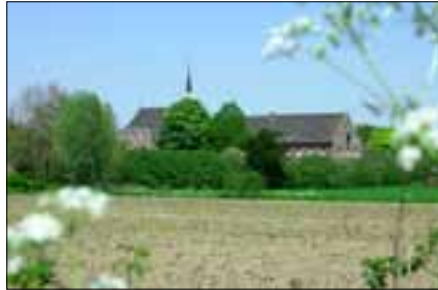
Klooster Soeterbeek in Ravenstein

onder grote rijkdommen en het samenleven van priesters met vrouwen. Hij zocht naar een eenvoudig christelijk leven, zoals beschreven in het Nieuwe Testament. Hij stichtte leefgemeenschappen van mannen en van vrouwen die streefden naar een praktische christelijke levensstijl: de Zusters en Broeders van het Gemene Leven. Aanvankelijk waren zij geen kloosterlingen, maar op zijn sterfbed raadde Geert Grote zijn geestverwanten aan om een klooster te stichten, om de vrije groepen te beschermen. Zo ontstond het klooster