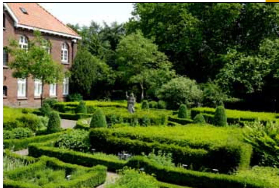
De kruidentuin.

Op de bronzen deuren die toegang geven tot het terrein van de zusters zijn scènes afgebeeld uit het leven van de Heilige Birgitta. De binnentuin van het kloostercomplex is ca. 30 jaar geleden beplant naar voorstelling van een middeleeuwse kruidentuin. Deze tuin bestaat uit strakke perken en heeft vier afdelingen: geneeskrachtige planten, keukenkruiden, verfstofplanten en min of meer zeldzame inheemse gewassen. In totaal staan er meer dan 150 plantensoorten.