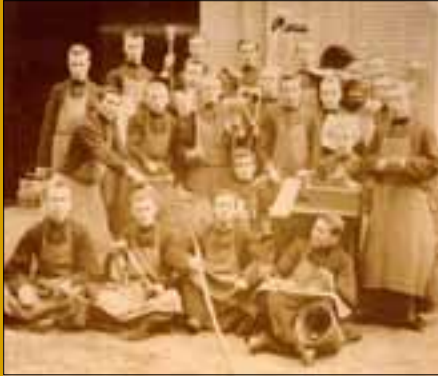
De novicen in Velp in het studiejaar 1884/1885

pastoors tussen 1636 en 1865 Jezuïeten. Zij maakten de pastorie van Ravenstein (Sint Luciastraat 3) tot het centrum van de Jezuïetenstatie. Van een klooster was geen sprake: de pastoor woonde in de pastorie samen met een of twee kapelaans, eveneens Jezuïeten. Zij zorgden voor de zielzorg in Ravenstein en omgeving.