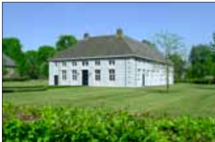
Museum De Kluis in Boekel

De oude kluis raakte bouwvallig en bovendien te klein, omdat zich meer broeders aansloten en er onderdak nodig was voor leerlingen. In 1734 was de bouw van een nieuwe kluis gereed, genaamd De Bloemendael. Bij de kluis werden een brouwerij en een hostiebakkerij gebouwd. De broeders riepen weerstand op: bij de brouwers in Gemert vanwege de concurrentie en bij de autoriteiten omdat zij de communiteit als een (verboden) kloostergemeenschap beschouwden. Een rustiger en veiliger plek werd gezocht en gevonden, een paar kilometer verderop in Boekel.