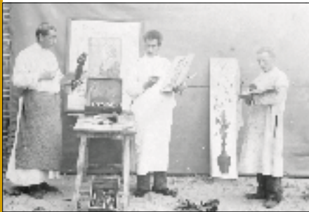
Creative therapie in Huize Padua, ca. 1930