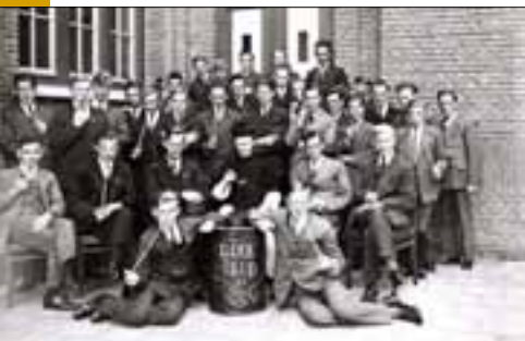
De rookclub van het college, 1931