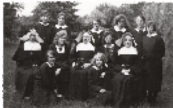
Franciscanessen van Veghel en leerlingen van de kweekschool, ca. 1930

Hierboven kwamen al de Clarissen in Megen, de Zusters Penitenten in Haren, de Kanunnikessen in Ravenstein, de Karmelietessen in Boxmeer en de Birgittinessen in Uden ter sprake. Deze zusters kregen in snel tempo gezelschap van andere gemeenschappen. Het is binnen de omvang van deze gids niet mogelijk om iedere nieuwe stichting te beschrijven. Wel vermelden we alle vestigingen die we tegenkwamen in de adreslijst achterin.