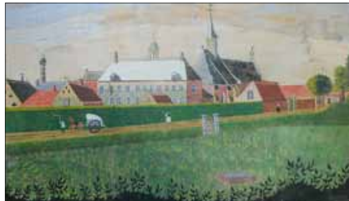
Het klooster in de tijd dat de Birgittinessen het gebouw kochten van de Kruisheren