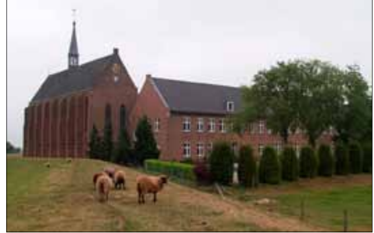
Kruisherenklooster Sint Agatha

Aan het begin van de Tachtigjarige Oorlog (1568-1648) lag het klooster van Sint Agatha gevaarlijk tussen de legers van de Spanjaarden en de troepen van Willem van Oranje. Daarom vroegen de Kruisheren aan prins Willem, sinds 1559 heer van het Land van Cuijk, om bescherming. Ze ontvingen van de Oranjes meerdere malen sauvegardes : vrijgeleides die hen