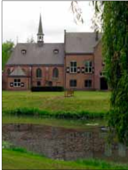
Klooster Bethlehem in Haren

dochters, die reeds als begijnen in Den Bosch leefden, betrokken het klooster samen met enkele andere vrouwen. De bisschop gaf hen toestemming voor de oprichting van een zusterklooster van de Orde van de Derde Regel van Sint Franciscus. De zusters leidden een eenvoudig leven, gericht op inkeer en beschouwing. Met het verrichten van handwerk zorgden ze voor inkomsten. Hun levenswijze kende verschillende vormen van boetedoening, ook wel 'penitenties' genoemd: dagelijks gewetensonderzoek, het schuldkapittel (het publiekelijk belijden van je fouten) en vastendagen. Zo kwam de naam Zusters Penitenten tot stand.