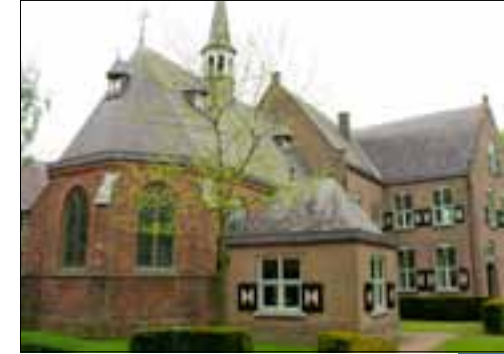
Klooster Bethlehem, Haren

De Franciscanen uit Den Bosch zwierven na de inname van Den Bosch als missionarissen rond in het Brabantse land. In 1645 stichtten zij