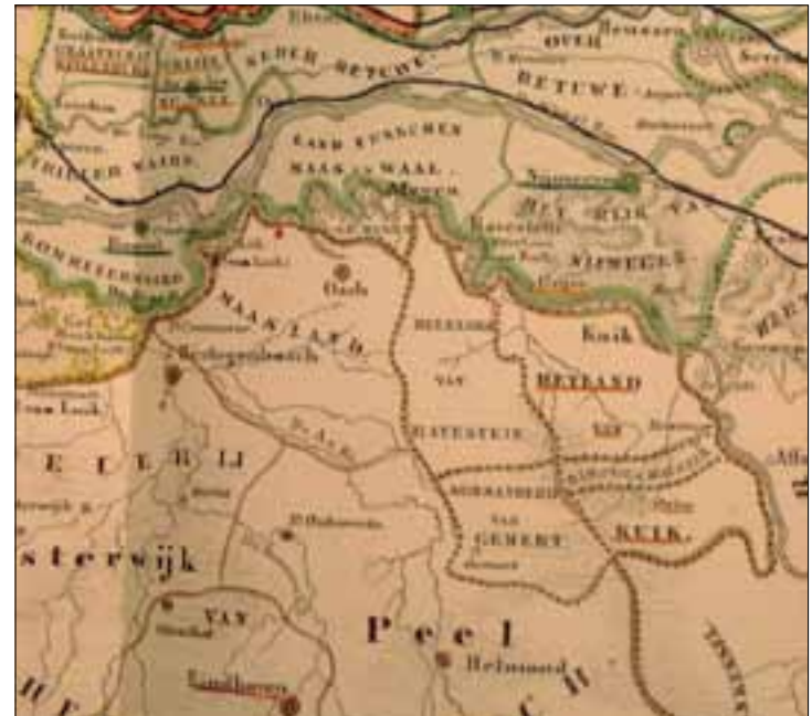
Noord-Brabant en de enclaves, detail uit de kaart van Nederland rond 1750 In: G. Mees Azn, Historische atlas van Noord-Nederland van de 16 e eeuw tot op heden (Rotterdam 1865)

De enclaves vormden als het ware kleine miniaturstaatjes, ingeklemd binnen het territorium van de Republiek der Verenigde Nederlanden: het Land van Ravenstein, het graafschap Megen, de baronie van Boxmeer, de commanderie van Gemert, het ambt Oeffelt en de baronie Bokhoven. Het bezitsrecht van deze gebieden ging veelal terug tot de 12 e eeuw. In die tijd kwamen ze in handen van families en sindsdien werden ze vererfd van vader op zoon.