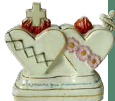
Spaarpot voor bijdragen aan de missie van de Paters van de Heilige Harten

Last but not least zijn naast de vele pater- en zustercongregaties in Noordoost-Brabant broedercongregaties werkzaam geweest. De grote onderwijscongregatie van de Fraters van Tilburg stichtte in 1859 in Grave het Instituut Sint Henricus