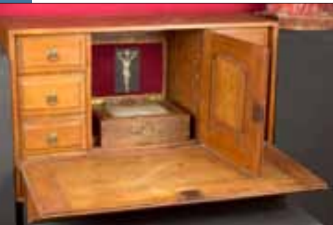
Altaarkoffer, gebruikt door paters Franciscanen op hun missietochten

De Fransen brachten in 1795 de godsdienstvrijheid naar Nederland. Katholieken mochten voortaan weer openlijk hun geloof belijden. Hier en daar kregen zij kerken terug, elders bouwden zij nieuwe.