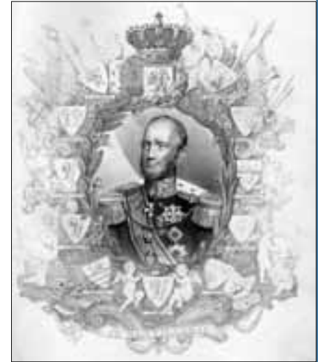
Koning Willem II. In: Gedenkboek der inhuldiging en feesttogten van Zijne Majesteit Willem II (Den Bosch, 1842)

Dat gebeurde ook daadwerkelijk. In de tweede helft van de 19 e eeuw nam het aantal orden en congregaties in Nederland in rap tempo toe. Zij openden met name in de zuidelijke provincies honderden nieuwe kloosters, die meestal een maatschappelijke functie hadden. Kloosterlingen waren er actief in het onderwijs, de gezondheidszorg, het maatschappelijk werk en het verenigingsleven. Ook werden veel jonge mensen opgeleid voor een taak in de missie. Na 1860 raakte met name Zuid-Nederland weer bezaaid met grote en kleinere kloosters.