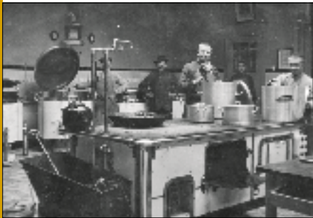
De keuken in Huize Padua, ca. 1920