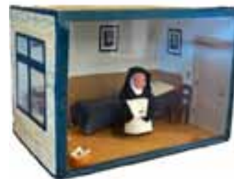
Uit de collecties van het erfgoedcentrum: miniatuurcelletje met Karmelietes

De kloostertuinen van Sint Agatha, die bekend staan om hun authentieke karakter, zijn dagelijks toegankelijk tussen zonsopgang en zonsondergang. Exposities in bezoekerscentrum, kloosterkerk en erfgoedcentrum zijn toegankelijk in de periode april-oktober. Op donderdagen en vrijdagmiddagen kunnen onderzoekers terecht in de studiezaal van het erfgoedcentrum. Nadere informatie over klooster, erfgoedcentrum, openingstijden en rondleidingen is te vinden op de website.