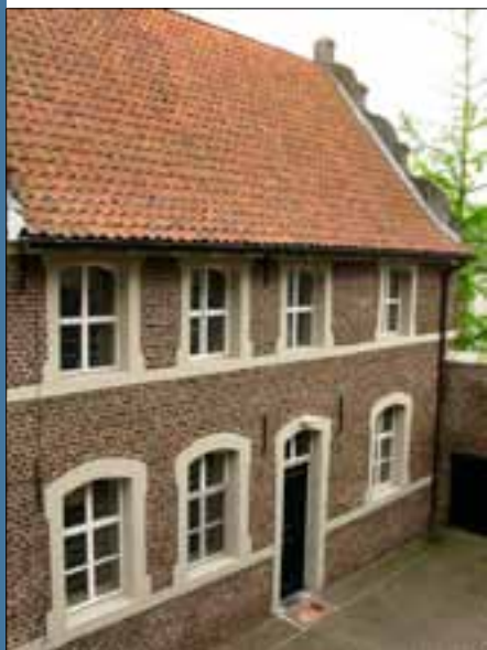
De voormalige Latijnse school van de Karmelieten in Boxmeer

een klooster in Megen. Van daaruit konden de paters hun pastoraatswerk verrichten, met name in het Land van Maas en Waal.