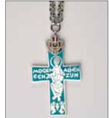
Het kruisje dat de Zusters Penitenten op hun habijt dragen

Na het vertrek van de zusters vestigde zich in het klooster van Haren een meubelpaleis. In 1991 werd het klooster gekocht door een horecaondernemer. Bij renovaties in de jaren negentig werden aanbouwen uit de loop van de tijd verwijderd (rectoraat, schoollokalen, bedrijfsruimtes). Het gebouwencomplex, nog steeds Klooster Bethlehem geheten, wordt momenteel gebruikt voor conferenties en feesten.