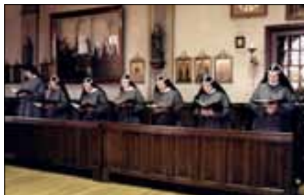
Zusters Birgittinessen tijdens het koorgebed

ofwel het klooster verlaten met een pensioen, ofwel blijven, maar dan zonder inkomen en met een verbod om nieuwe leden aan te nemen. De zusters kozen voor het laatste. Net als bij andere vrouwenkloosters in de omgeving namen zij in de jaren daarna wel kostjuffrouwen op. Feitelijk ging het om vrouwen die een kloosterleven wilden leiden. Toen Willem II in 1840 het verbod op nieuwe kloosterlingen ophief, konden zij hun kloostergeloftes afleggen. Er begon een nieuwe periode van bloei. De zusters maakten een nieuwe start met hun school en stichtten vanuit Uden een klooster in Weert. De Birgittinessen zijn slotzusters, hetgeen betekent dat zij in afzondering leven. In de 20 e eeuw werd het slotzusters niet langer toegestaan om activiteiten voor derden te organiseren. Hun leven heeft een sterk contemplatief karakter. Voor de Birgittinessen speelt het overwegen van het lijden en de opstanding van Christus een grote rol. Het geloof in nieuw leven na de dood vormt de kern van hun religieuze bestaan. Daarnaast is het gebed voor de medemens een belangrijke taak. En ook hebben de zusters het ideaal om zelf in hun levensonderhoud te voorzien.