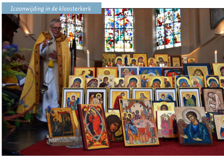
Icoonwijding in de kloosterkerk