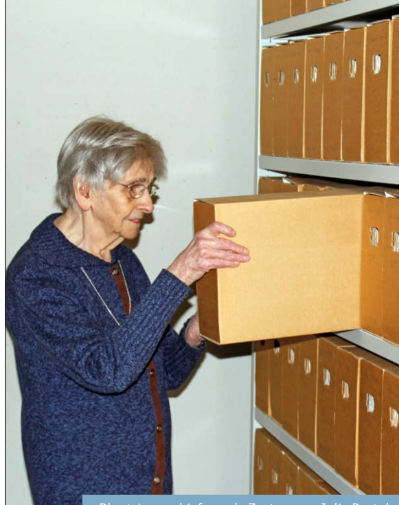
Plaatsing archief van de Zusters van Julie Postel