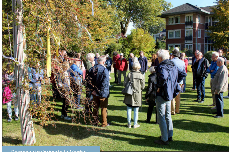
Personeelsuitstapje in Veghel