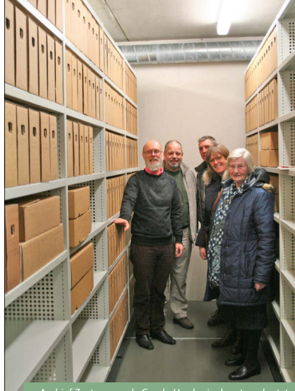
Archief Zusters van de Goede Herder in depot geplaatst