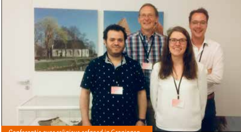
Conferentie over religieus erfgoed in Groningen