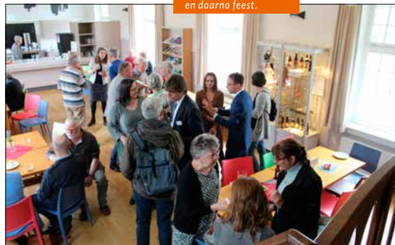
en daarna feest.