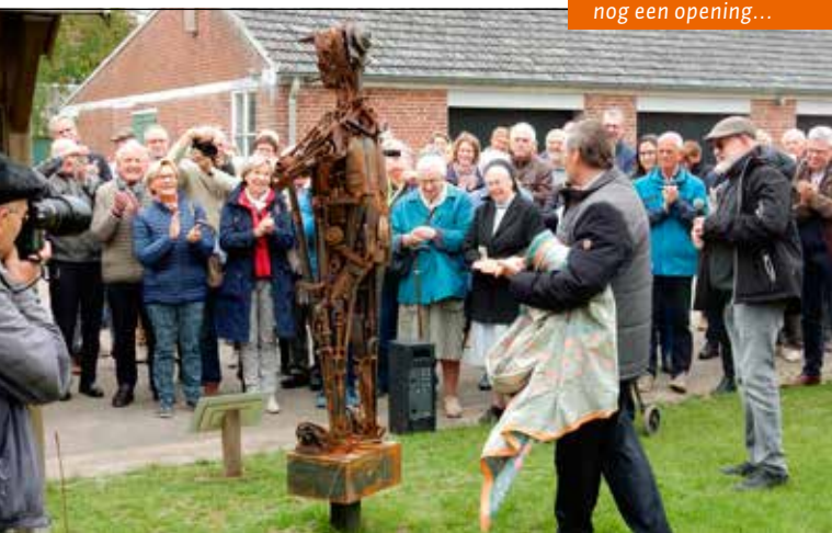
nog een opening...