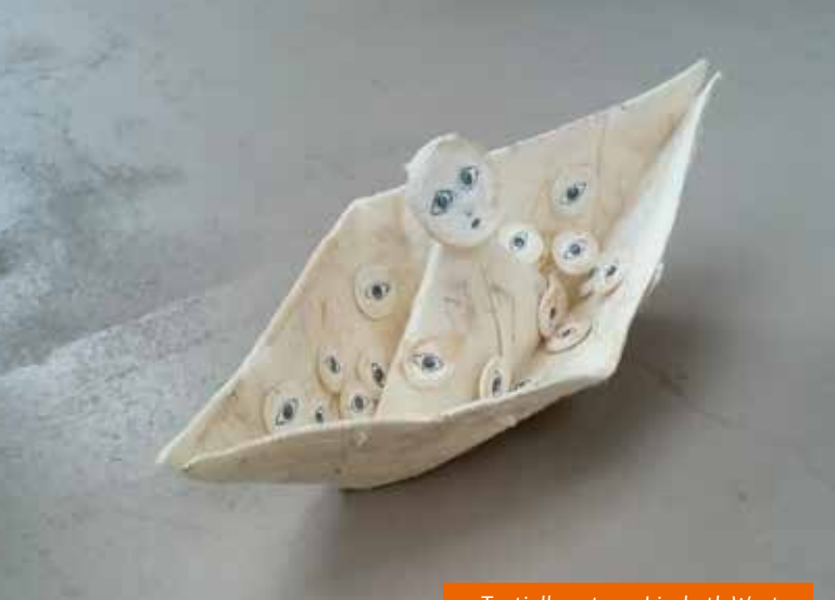
Textielkunst van Liesbeth Werts