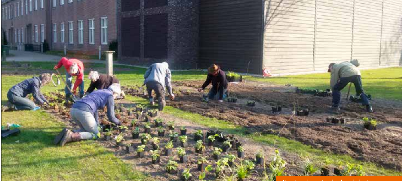
Veel handen poten heel veel planten