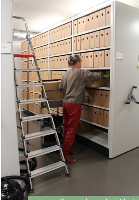
Voorjaars schoonmaak in het depot