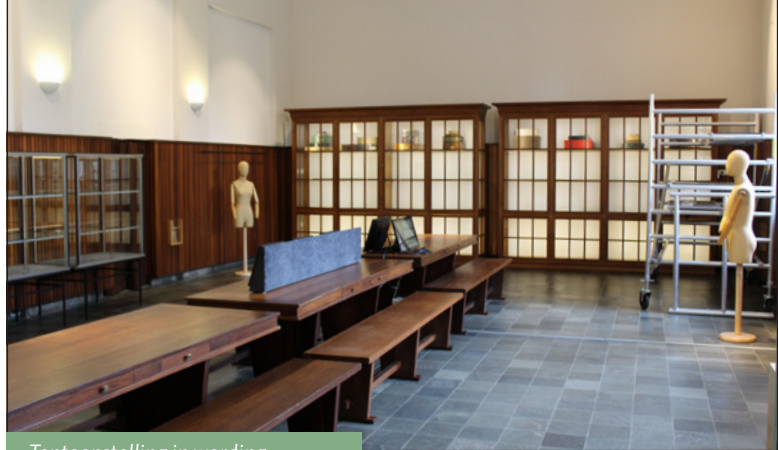
Tentoonstelling in wording