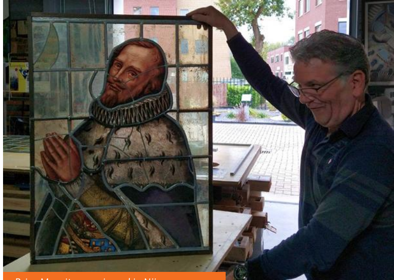
Prins Maurits gearriveerd in Nijmegen