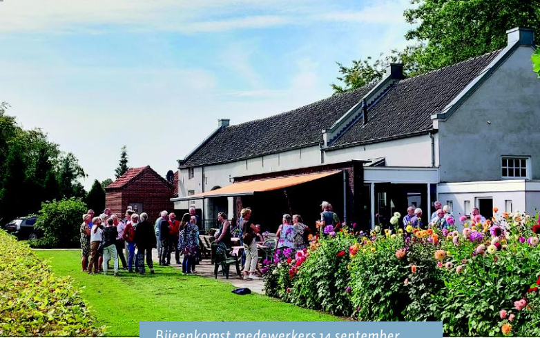
Bijeenkomst medewerkers 14 september

medezusters bespreken. Ze voelde ruimte om bijvoorbeeld te praten over twijfels en hoop rond het geloof en een leven na de dood. Na het eerste interview zette Annelies van Heijst de opname even stil: het was 10.00 uur en tijd voor koffie, wat zuster Veronica helemaal was vergeten. > Susan Scherpenisse