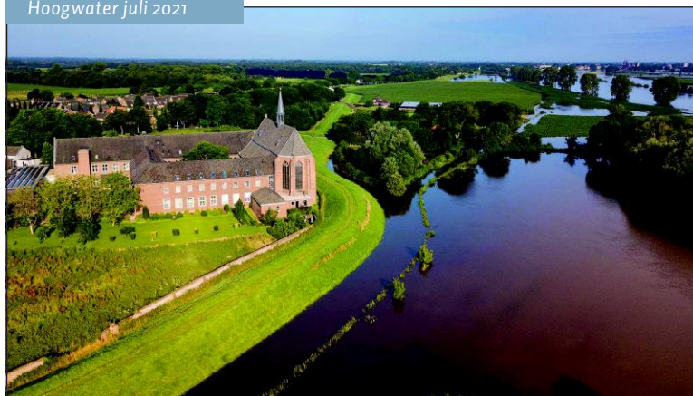
Hoogwater juli 2021