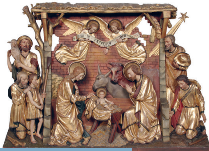
Kersttableau, collectie Redemptoristinnen

Opnieuw is een jaar bijna ten einde. De Kroniek doet verslag van recente ontwikkelingen, waarbij verschillende collecties van het Erfgoedcentrum aan de orde komen. Van harte wensen we u fijne Kerstdagen en een goed 2023.