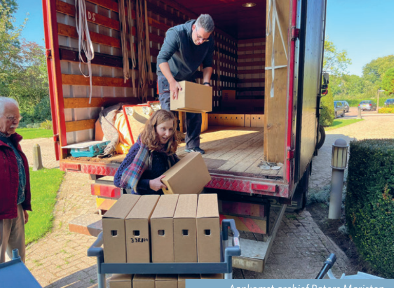
Aankomst archief Paters Maristen