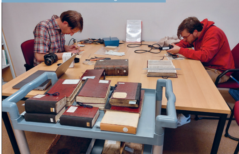
Restauratoren bestuderen de Frenswegencollectie