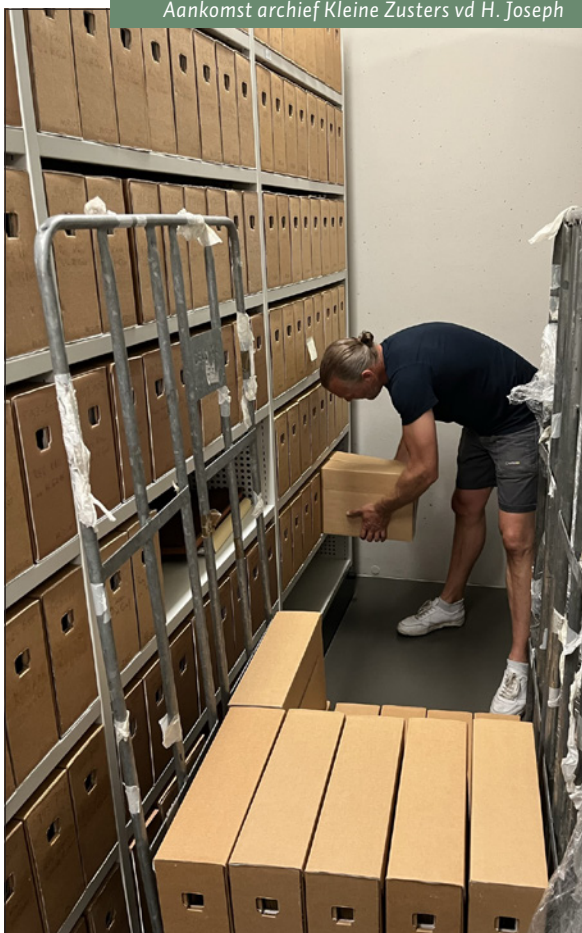
Aankomst archief Kleine Zusters vd H. Joseph