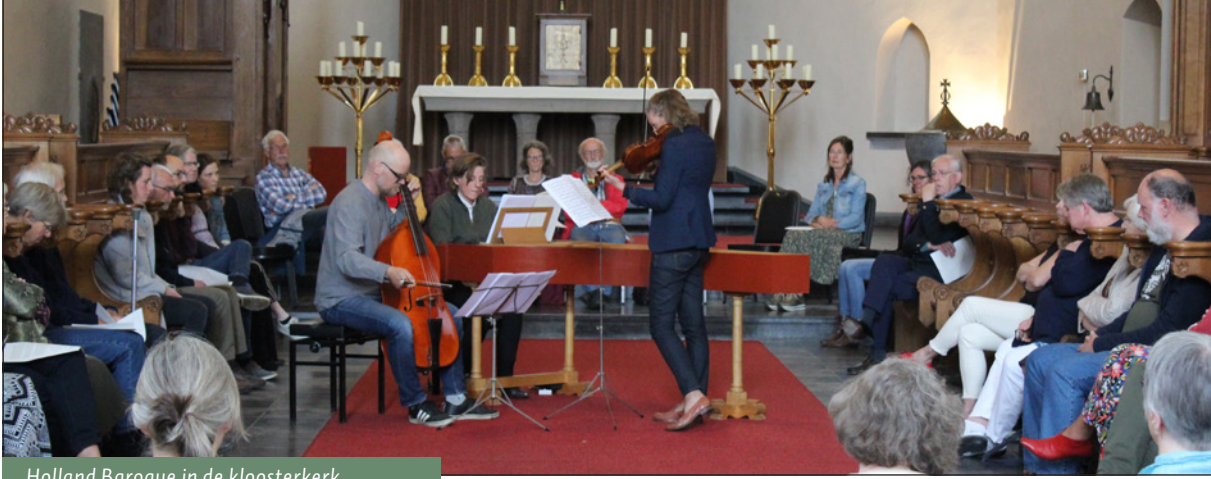
Holland Baroque in de kloosterkerk