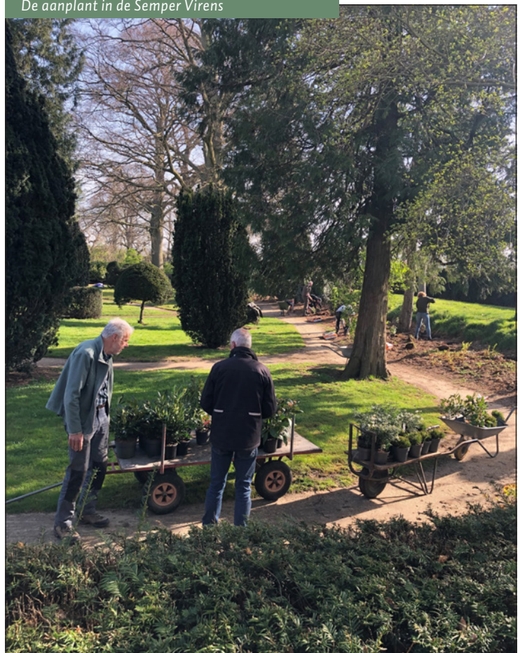
De aanplant in de Semper Virens