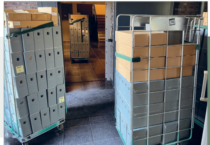
Aankomst archief Fraters van Tilburg

De nieuwe stellingskasten zijn al voor een groot deel in gebruik genomen. In een afgesloten ruimte staan de onbewerkte aanvullingen op reeds overgebrachte archieven, wachtend op het moment dat een archivaris ermee aan de slag gaat. Ook de materiaalvoorraad,