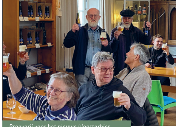
Proeverij voor het nieuwe kloosterbier

Cuijk rond de start van het bezoekersseizoen.