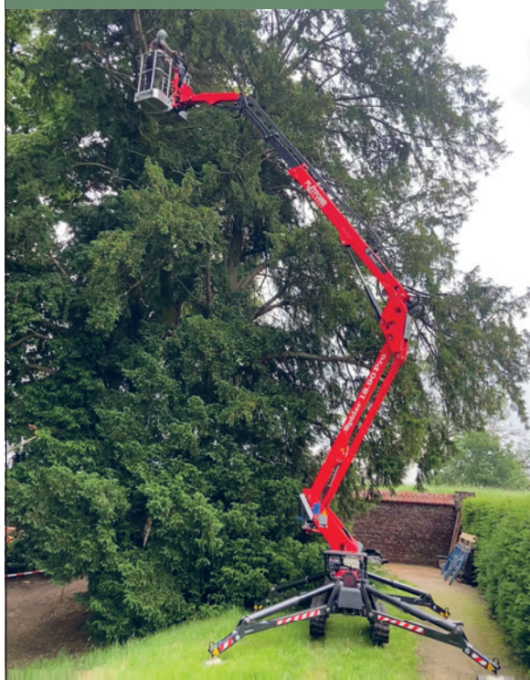
Rooien van een taxus in de kloostertuin