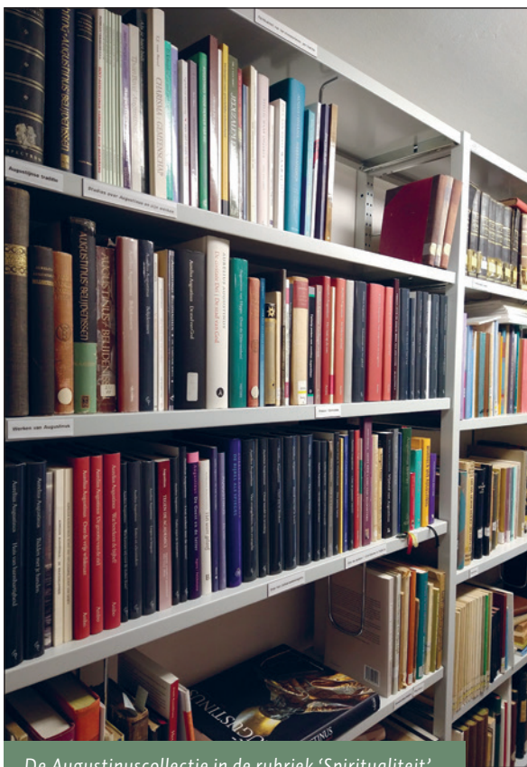
De Augustinuscollectie in de rubriek 'Spiritualiteit' op de 1e verdieping van de studiezaal