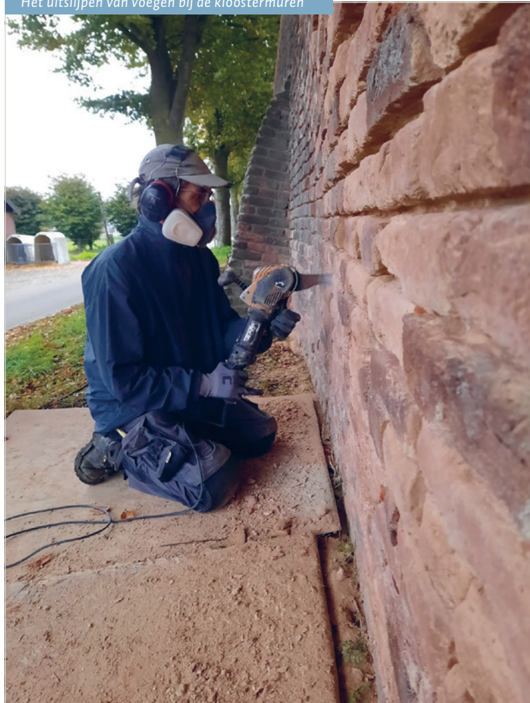
Het uitslijpen van voegen bij de kloostermuren

De derde bijzondere activiteit heeft als doel de digitale presentatie van collecties in het Erfgoedcentrum te versterken. Het gaat om drie deelprojecten. Op de eerste plaats wordt de digitalisering voorbereid van ruim 20 meter archiefmateriaal over de werkzaamheden van kloosterlingen in het Caribisch gebied, binnen een voorziening en subsidieregeling van de Koninklijke Bibliotheek (Metamorfoze). Na afloop kunnen onderzoekers van deze archiefstukken zowel de beschrijvingen als de inhoud online raadplegen. Het tweede project dat geïnitieerd wordt, betreft de koppeling van data van het Erfgoedcentrum aan de websites oorlogsbronnen.nl en onland.nl . De laatstgenoemde website toont bronnen van een groot aantal erfgoedinstellingen over de gedeelde geschiedenis van Nederland en Indonesië. Omdat het overgrote deel van de orden en congregaties betrekkingen had (en heeft) met Indonesië, mogen de collecties van het Erfgoedcentrum hier niet ontbreken. Met het derde project is reeds een begin gemaakt: de digitale presentatie van de filmcollectie in het Erfgoedcentrum via de website www.erfgoedkloosterleven.nl en de website BrabantinBeelden van het Brabants Historisch Informatie Centrum. > M. Arendsen