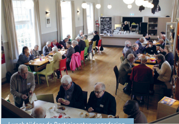
Lunch tijdens de Participantenvergadering