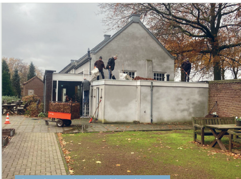
De tuinploeg verwijdert blad van daken en dakgoten