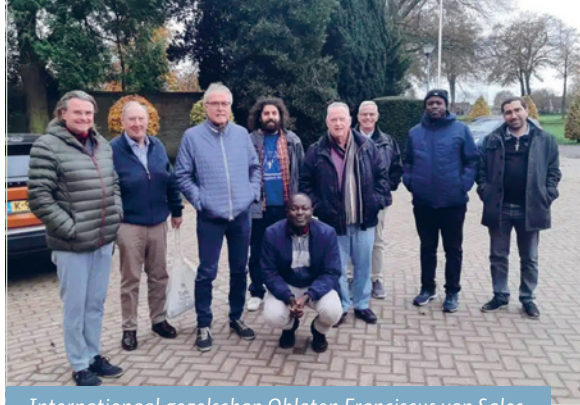
Internationaal gezelschap Oblaten Franciscus van Sales