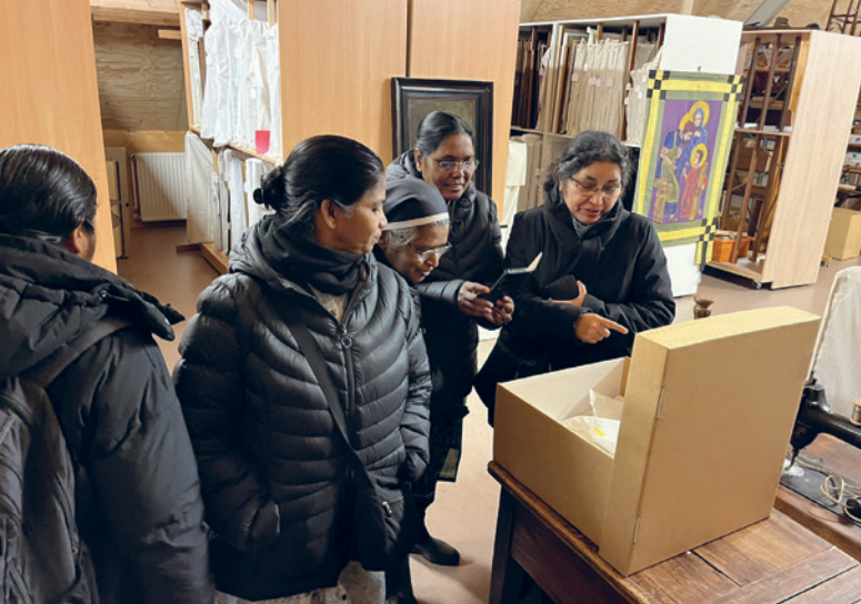
Bezoek van bestuursleden van de Indiase dochtercongregatie van JMJ