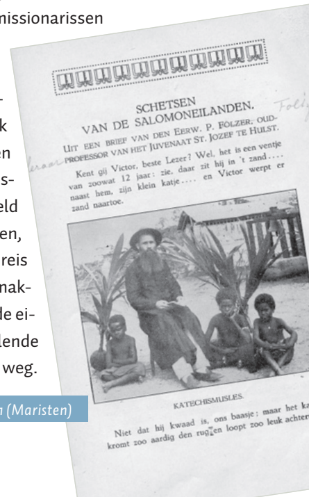
Een pagina uit het tijdschrift Heilige Kruistocht , 1921 (Maristen)

“Neem een atlas of globe en bekijk Oceanië.” Dit is in 1963 een rubriek in het Maristen-tijdschrift Heilige Kruistocht . Het werelddeel Oceanië bestaat uit Australië en een groot aantal eilanden. Het was één van de verst gelegen en lastigst te bereiken missiegebieden. Vanaf 1825 werkten hier de Paters van de HH. Harten. Zij vroegen aan de paters Maristen, een jonge en idealistische Franse congregatie, om assistentie. In 1836 voeren de eerste Maristen-missionarissen om Zuid-Amerika heen naar het gebied; ze waren bijna een jaar onderweg. Begin 20 e eeuw waagden ook Nederlandse missionarissen zich aan deze moeilijke missie. Ze gingen bijvoorbeeld naar de Salomonseilanden, Nieuw-Caledonië en Fiji. De reis werd na verloop van tijd gemakkelijker en ging sneller, maar de eilanden – met al hun verschillende talen en culturen – bleven ver weg.