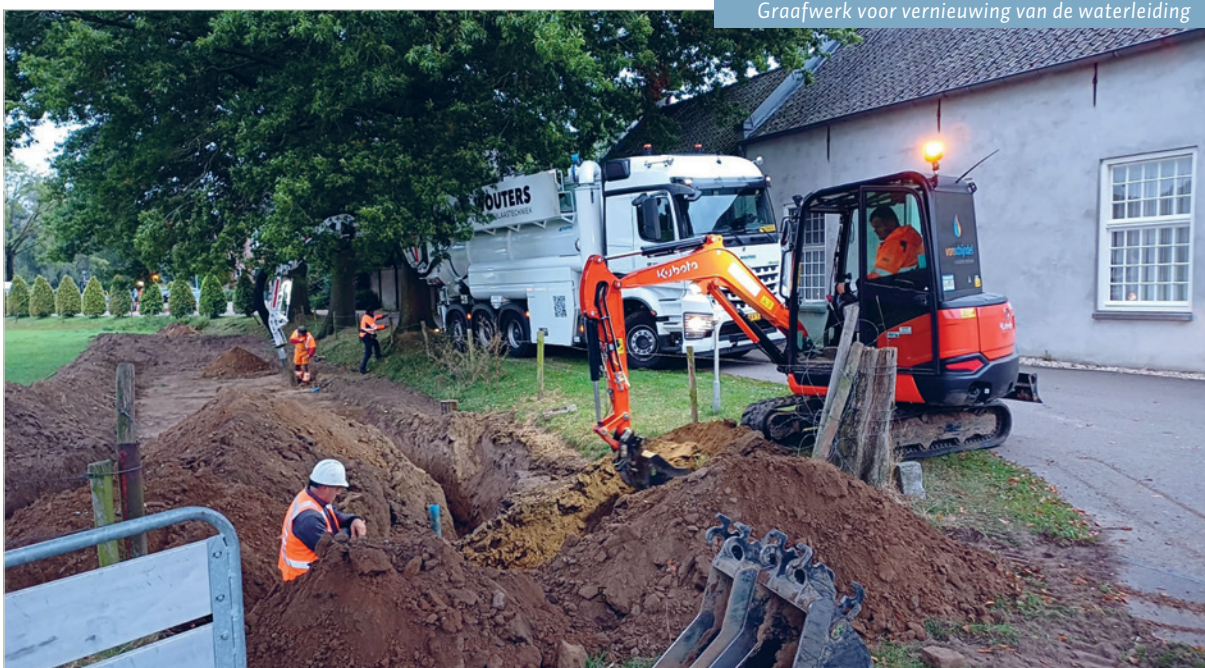
Graafwerk voor vernieuwing van de waterleiding