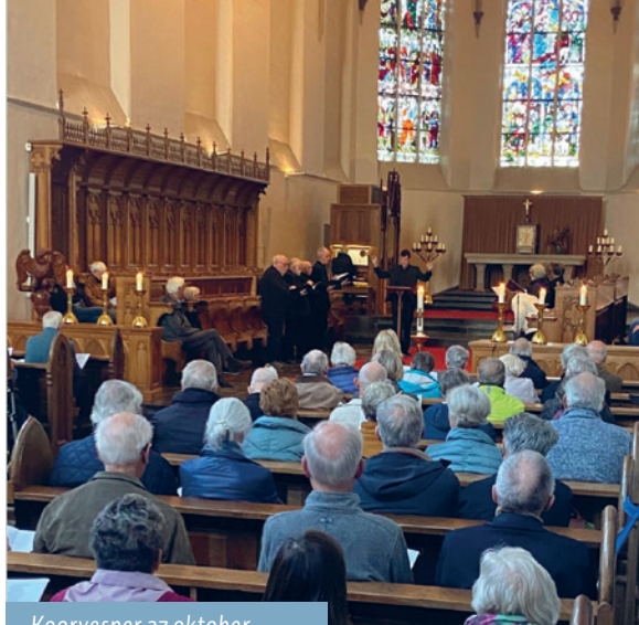
Koorvesper 27 oktober